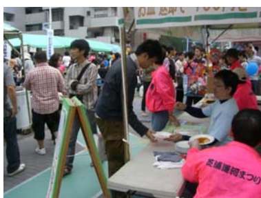
貸出所でリユース食器を貸し出す様子