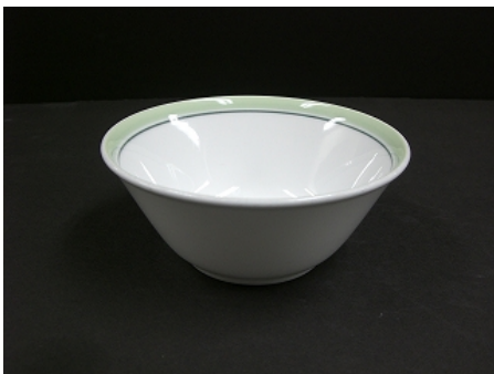
小鉢（径 13cm、高さ 5cm）500 枚

港区清掃リサイクル課は使われなくなった学校給食の食器を貸し出しています（保有数は平成 19 年現在）。皿類のほか、箸（質感や長さの異なるもの。全 3 種類）を 1,000 膳借りることができます（箸についてはイベントの規模によっては不足することがあります）。区が貸出す食器は陶器製であり風で飛ばされることはありません。