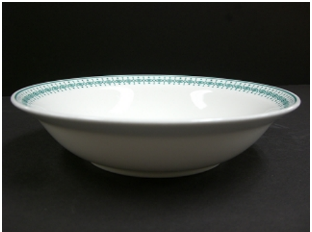
深皿大（径 19cm、高さ 4cm）200 枚