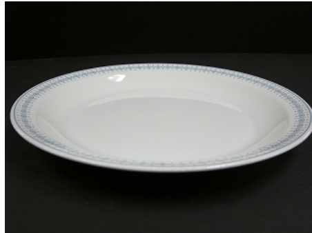
平皿（径 20cm、高さ 2cm）4,500 枚