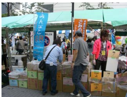
ごみの分別ステーションの様子