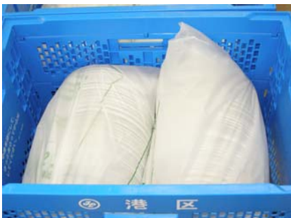
←コンテナに保管されている状態

リユース食器の利用に関しては「港区版 リユース食器を利用したエコイベントマニュアル～イベントのごみを減らしましょう～」をご覧ください。