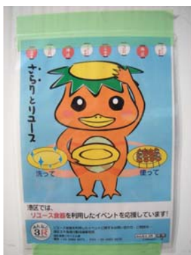
カッパのポスターを会場に掲示した。