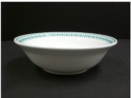
深皿小（径 14cm、高さ 4cm）1,000 枚